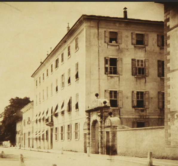
La filanda Tambosi a Santa Croce, 1874